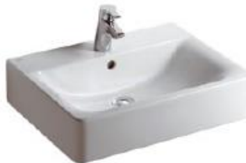
Connect umyvadlo Cube bílá 50 cm