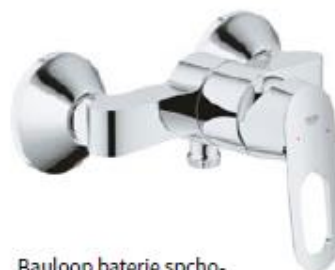
Bauloop baterie sprchová chrom bez přísl.