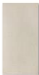
Běžová 20x40 cm