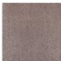
Šedohnědá 33x33 cm