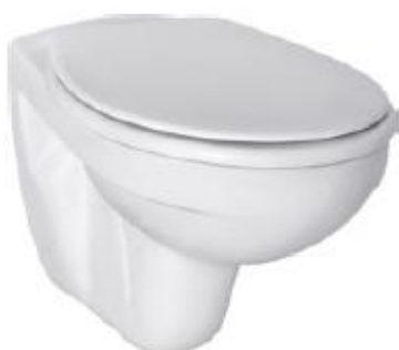
Eurovit WC závěsné bílá Eurovit sedátko soft-close bílá