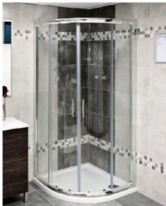
Elba sprch.zástěna 1/4 kruh chrom/sklo 90