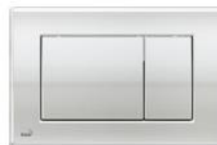
Tlačítko M271, chrom Přísl. izolační deska