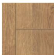
Dub portland natur