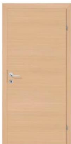
Hobby-Q Eiche Hell

Obložková zárubeň JELD-WEN, K97, povrch CPL (javor, buk, světle šedá, bílá, pór jasan bílý, dub krémový, dub světlý, třešeň coffee, ořech noce, pískový dub, dub barrique), polodrážková varianta – viditelné závěsy, ostění MST 1 (do 170 mm), pro průchozí rozměry 600,700,800,900x2010mm.