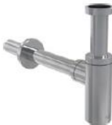
Přísl. sifon umyvadlový kov chrom kulatý