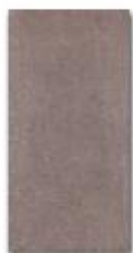
Šedohnědá 20x40 cm