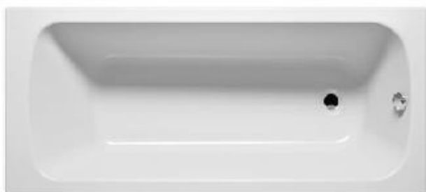
Active vana - bílá 170x75 cm