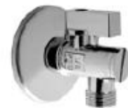
Roháček s filtrem 1/2x3/8