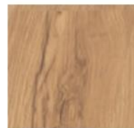
Dub alpský natur