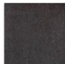
Černá 33x33 cm