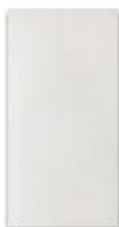
Bílá 20x40 cm