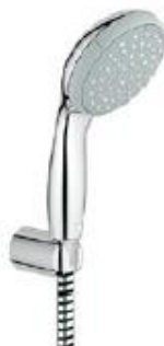
New Tempesta ruč.sprcha s držákem a hadicí II chrom 1250 mm