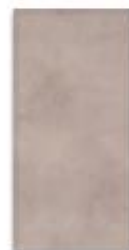
Hnědá 20x40 cm