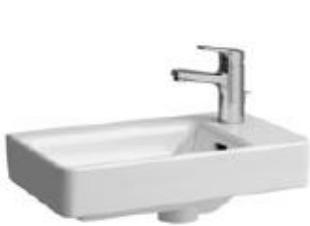
Pro umývatko 1otv.pravé bílá 48 cm