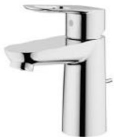
Bauloop baterie umyvadlová S chrom s výpustí