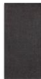
Černá 20x40 cm