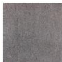
Šedá 33x33 cm