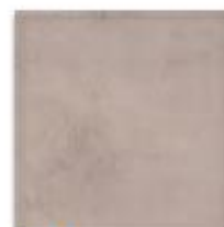
Hnědá 33x33 cm