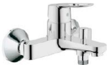
Bauloop baterie vanová chrom bez přísl.