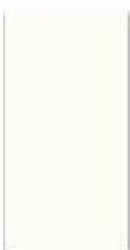
Bílá 20x40 cm