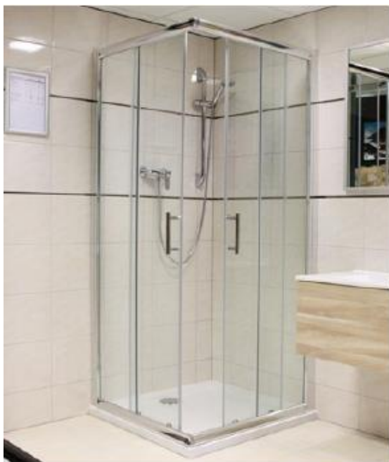
Elba sprch.zástěna čtverec chrom/sklo 90