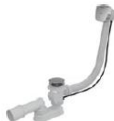
Přísl. sifon vanový aut. chrom