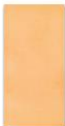
Oranžová 20x40 cm