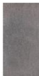
Šedá 20x40 cm